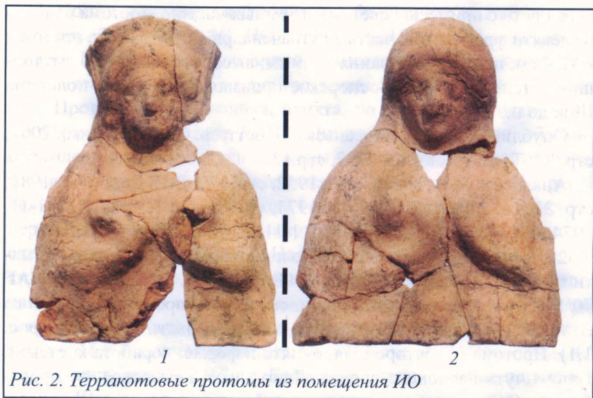
Рис. 2. Терракотовые протомы из помещения ИО

именно на эту категорию терракоты. Ниже приводится описание протом.